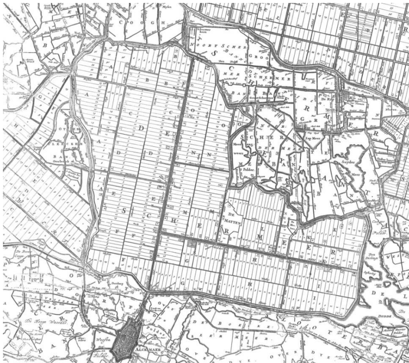
Kaartblad met de Schermer en het Schermereiland uit de 16-bladskaart van Uitwaterende Sluizen, 1680, J.J. Dou, C. Decker en A. Deur

In 1660 gaf het toenmalige Hoogheemraadschap van de Uitwaterende Sluizen opdracht een enorme kaart van het werkgebied te maken. Dat besloeg heel Noord-Holland benoorden het IJ. Gelukkig kon de ingehuurde landmeter J.J. Dou uit Leiden soms terugvallen op bestaande kaarten. Maar toch was hij vele jaren bezig. Het hoogheemraadschap liet zijn handgetekende kaart direct in 16 koperen platen graveren die als een legpuzzel aan elkaar pasten. De eerste druk rolde in 1680 van de pers. Deze kaart was voor die tijd een wonder van precisie. Men liet hem tot het einde van de 18 e eeuw regelmatig herdrukken waarbij alleen de wapens van de bestuursleden werden aangepast. Natuurlijk was deze grote wandkaart ook een indrukwekkend statussymbool. Een echt hoogheemraadschap kon gewoon niet zonder zo'n kaart!