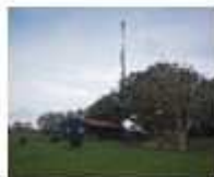
19. Seinmast Spijkerboor