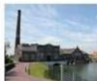
11. Stoomgemaal De Vier Noorderkoggen