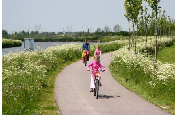
Fietsers op de Zuiddijk van de Beemster.

In deze visie op het Watererfgoed wordt omschreven hoe HHNK de ambitie uit het collegeprogramma verder vorm geeft en welke stappen we daartoe ondernemen. Centraal in de visie staan drie leidende principes. Deze principes zijn gedistilleerd uit onderzoek, de gesprekken, ervaringen en belevenissen die we de afgelopen maanden met bestuursleden, medewerkers, collega-overheden, erfgoedorganisaties en geïnteresseerden gevoerd en beleefd hebben.