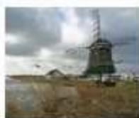
3. De Woudaap