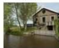
8. Gemaal polder Beetskoog