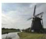
2. De Dog