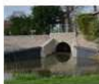
14. Sluis polder Burghorn