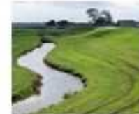
24. Noorder U en Zeedijken