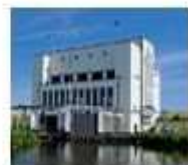
10. Gemaal Lely