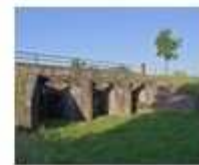
16. Inundatiesluis zuidelijke Beemsterdijk