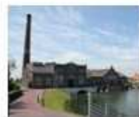
11. Stoomgemaal De Vier Noorderkoggen