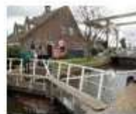
18. Schutsluis Rustenburg