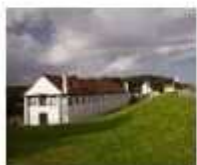
9. Gemaal Leemans