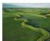
23. West-Friese omringdijk