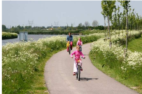
Fietsers op de Zuiddijk van de Beemster.

In deze visie op het Watererfgoed wordt omschreven hoe HHNK de ambitie uit het collegeprogramma verder vorm geeft en welke stappen we daartoe ondernemen. Centraal in de visie staan drie leidende principes. Deze principes zijn gedistilleerd uit onderzoek, de gesprekken, ervaringen en belevenissen die we de afgelopen maanden met bestuursleden, medewerkers, collega-overheden, erfgoedorganisaties en geïnteresseerden gevoerd en beleefd hebben.