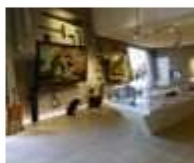
22. Waterschat Centrale kantoor HHNK