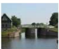
17. Jacob Cleesse sluis