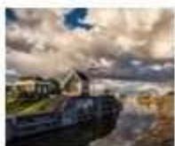
13. Zeesluis Edam