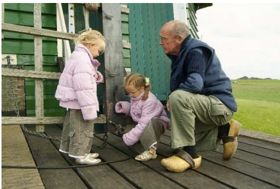
De molenaar van de Katwoudermolen en twee jonge bezoekers. Zien, voelen en beleven voor jong en oud.

Overigens is cultureel watererfgoed geen statisch begrip. De inhoud ervan verandert voortdurend. Niet alles wat 'oud' is ontvangt het predicaat erfgoed. De samenleving bepaalt wat wel en niet wordt bewaard. Elke generatie maakt hierin eigen keuzes. Deze visie is dan ook nooit af en zal gaandeweg de tijd aangepast worden aan de mores van het tijdsgewricht.