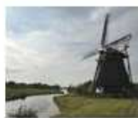
2. De Dog