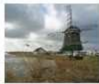
3. De Woudaap