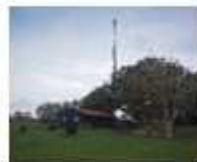
19. Seinmast Spijkerboor