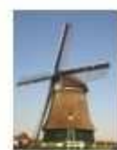
4. Katwoudermolen de Kathammer