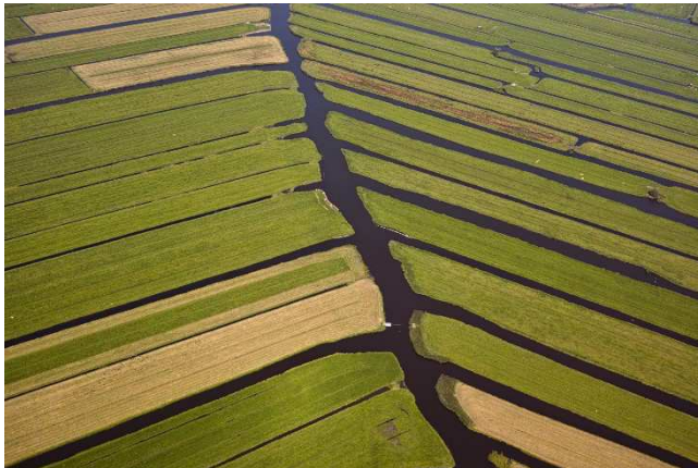
Veenweidegebied Zeevang. Om het moerassige veen te ontwateren, werden slootjes het veen in gegraven. Dit is nog steeds zichtbaar in dit bijzondere veenweidelandschap.

Hoogheemraadschap Hollands Noorderkwartier (HHNK) heeft een breed scala aan cultureel historisch erfgoed in bezit en in beheer. Door de lange en rijke geschiedenis van de waterschappen in Noord-Holland gaat het om een veelheid aan erfgoed: materieel en immaterieel (te weten verhalen), roerend en onroerend alsook markante landschappelijke elementen. De hensbekers, bodebussen, sluizen, gemalen, molens, polders, dijken en dijkpalen vertellen het verhaal van onze oorsprong. Het zijn sporen van het waterbeheer door de eeuwen heen. Waterbeheer dat voor Noord-Holland een scheppende en vormende rol heeft (gehad), terug te zien in het landschap en de inrichting van het gebied. Deels bestaat dit erfgoed uit waterwerken die ons land nog steeds beschermen en noodzakelijk zijn om hier te leven met water, het zogenoemde operationele erfgoed. Het erfgoed is een kostbaar bezit, het draagt bij aan het historisch besef en aan het collectieve geheugen, het is onderdeel van het DNA van Noord-Holland.