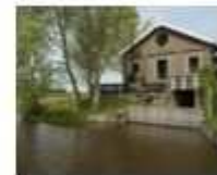
8. Gemaal polder Beetskoog