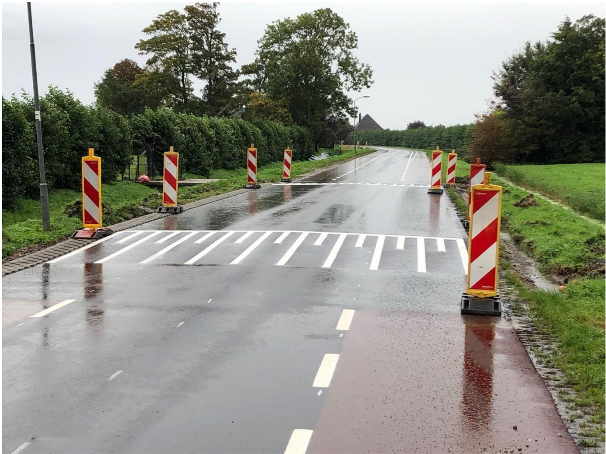
Figuur 3 Voorbeeld plateaus. Huidige locatie: Hemweg. Let op! Er zullen geen rode fietssuggestiestroken op de Wijmers en Jongeweer worden aangebracht.